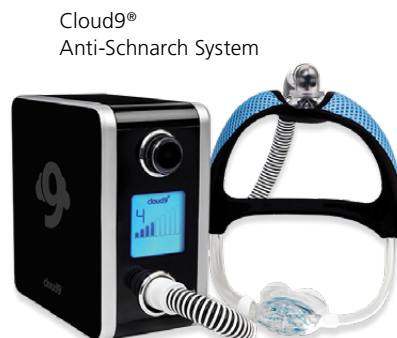
Cloud9® Anti-Schnarch System